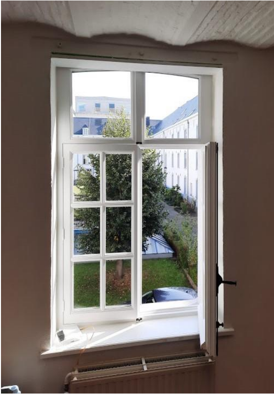
Eén van de nieuwe ramen met 'historiserend profiel'.