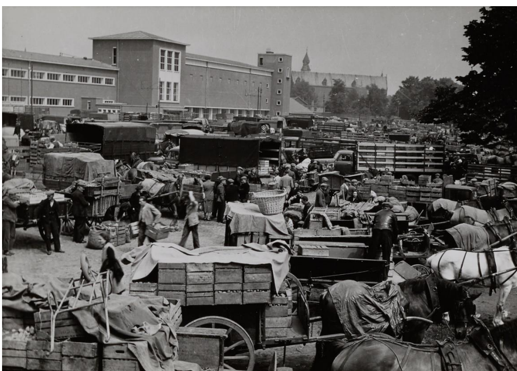
Drukke aan de Groentenmarkt aan de Zandpoortvest, circa 1950.