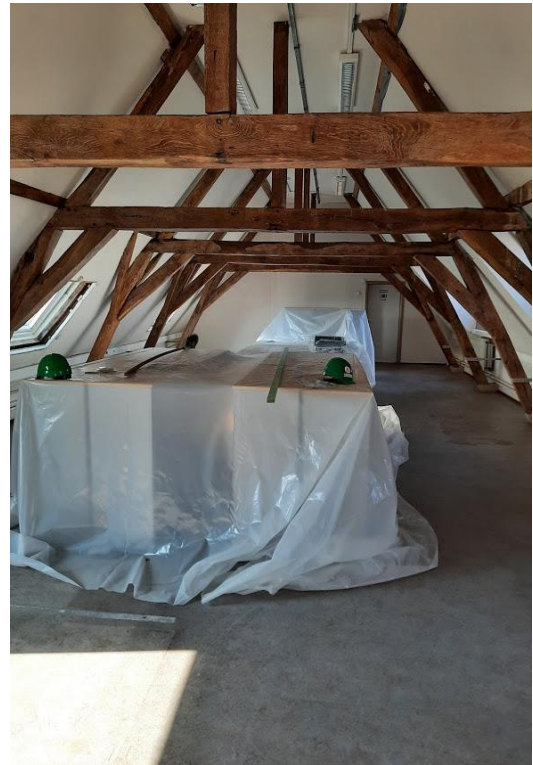
Voormalige leeszaal 3 de verdieping, afgedekt meubilair