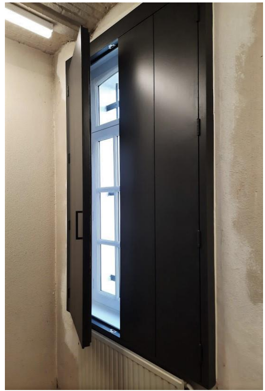
Alle ramen in de depots kregen binnenluiken.