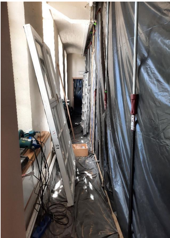
Stofwanden in de depots tijdens de raamwerken.