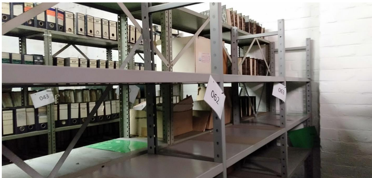
OCMW-depot Battelsesteenweg, nummering van de rekken als voorbereiding van de registratiewerkzaamheden.

In 2021 ging het Stadsarchief aan de slag met het semi-statische en statische papieren OCMW-archief in een archiefruimte aan de Battelsesteenweg. Op deze bewaarlocatie bevindt zich ongeveer één strekkende kilometer documenten van het OCMW. Het gaat om onder andere financieel archief, sociale dossiers, vastgoeddossiers en verslagen van de OCMW-bestuursorganen. Het archief bevat documenten uit de ruime periode van de 19de eeuw tot het begin van de 21ste eeuw. Grote delen ervan hebben erfgoedwaarde en zijn relevant voor de sociale geschiedenis van Mechelen in deze periode. Door de aanwezigheid van schimmels op de documenten en de toekomstige herbesteding van het gebouw was er een dringende aanpak van het archief nodig.